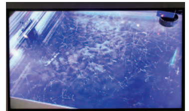
霧箱(放射線の飛跡を見ることが出来る装置)

参加者は、日本に2基だけの360度全球型シアターの体験や、目に見えない放射線を身近なものに例えて学ぶことができました。